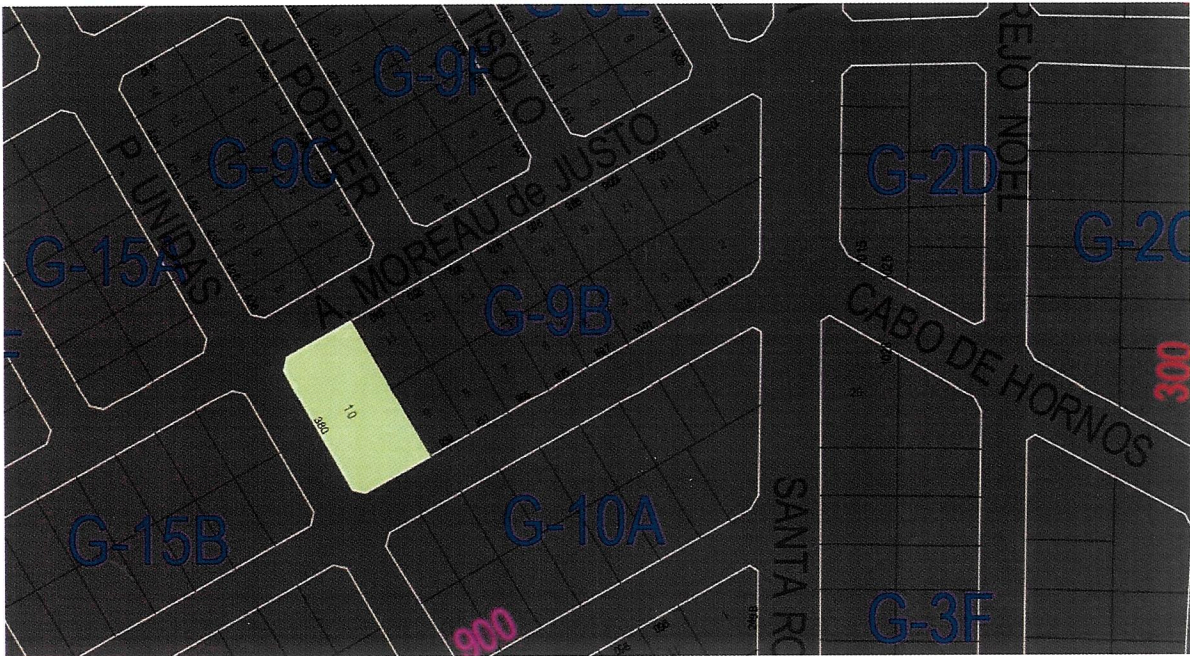
Imagen de la ubicación del espacio Sector G, Macizo 9 B, Parcela 10. Situado entre las calles Provincias Unidas, Alicia Moreu de Justo y Cabo de Hornos.