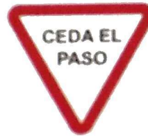
Cartel de señalización vertical reglamentario R 28 "CEDA EL PASO"