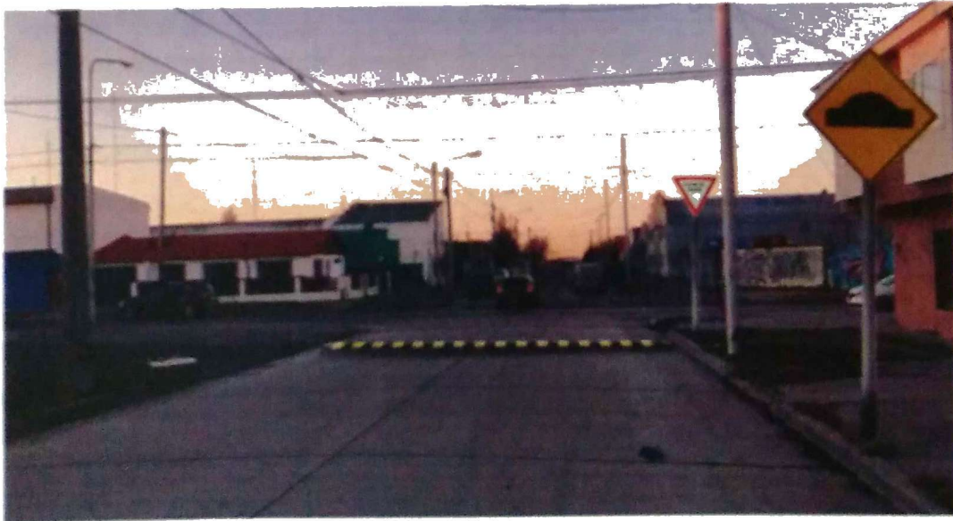
Implantación de las señales y del reductor de velocidad en la arteria

"Las Islas Malvinas, Georgias del Sur y Sandwich del Sur son y serán Argentinas"