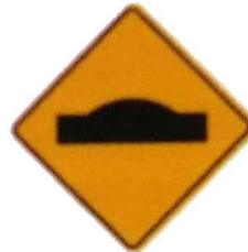
Cartel de señalización vertical "Reductor de Velocidad"