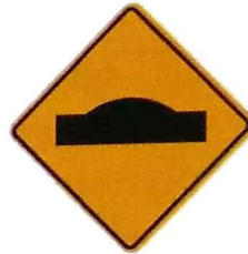
Cartel de señalización vertical "Reductor de Velocidad"