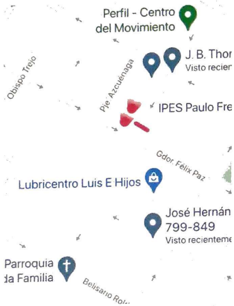
Ubicación y dirección de las señales y el reductor

Tema: Colocación reductor de velocidad y colocación cartel de señalización vertical de seguridad vial sobre calle Juan Bautista Thorne.