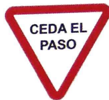
Cartel de señalización vertical reglamentaria R.28 "CEDA EL PASO"